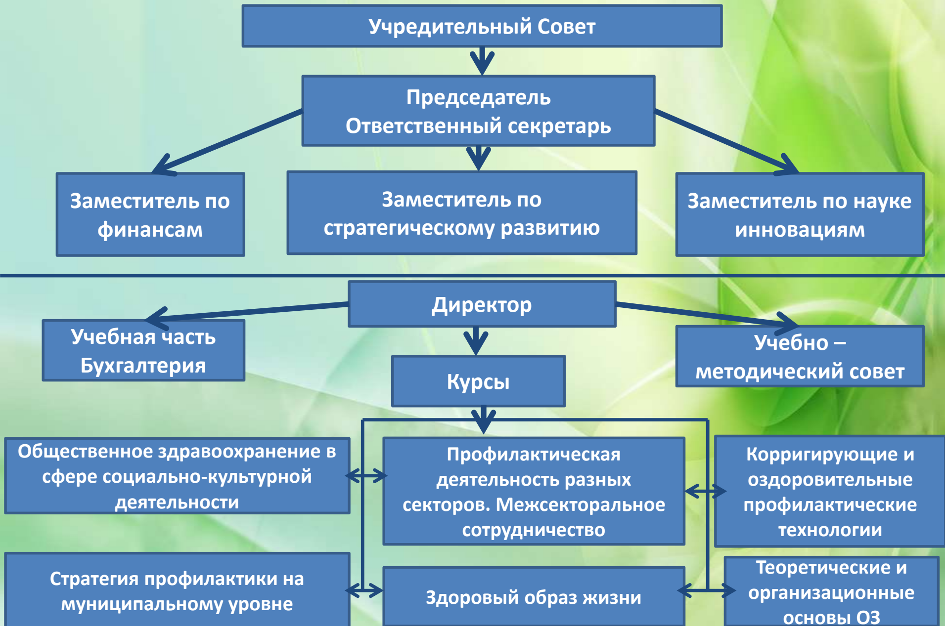
Схема организации центра (УЦОЗ)